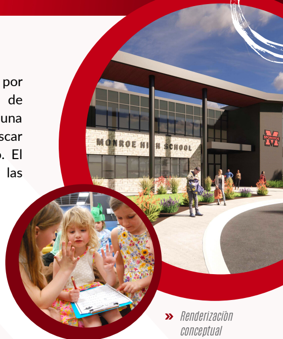
» Renderización conceptual

En julio de 2021, el Comité de Instalaciones del Distrito reanudó sus reuniones para discutir el próximo enfoque del plan de modernización de las instalaciones del Distrito y para investigar las opciones para abordar el deterioro de la Monroe High School. Durante los siguientes meses, el Comité de Instalaciones investigó y discutió varias soluciones y presentó dos opciones a la Junta de Educación en noviembre de 2021. Una encuesta de la comunidad determinó que la construcción de una nueva escuela en un nuevo sitio fue el más apoyado por nuestras familias y las partes interesadas. Sesenta y tres por ciento de los encuestados estaban a favor de este plan.