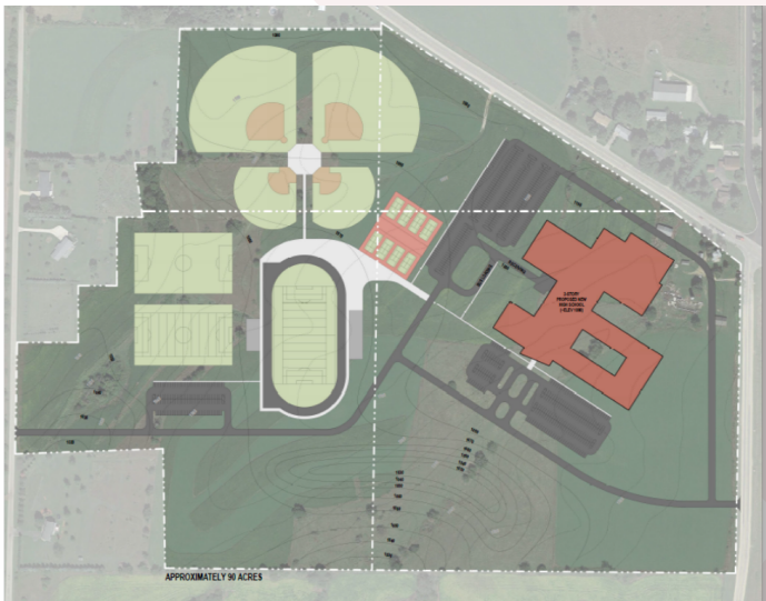
» Plano conceptual del emplazamiento